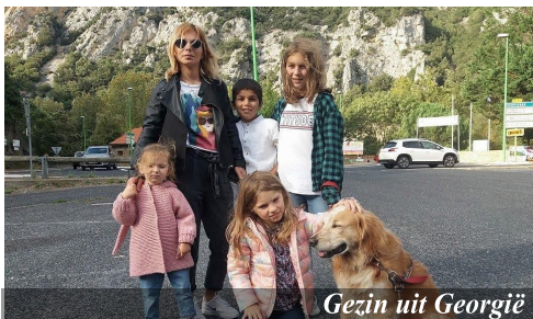
Gezin uit Georgië

zal worden boven de Hoge Vallei, vele mensen Hem persoonlijk gaan leren kennen als hun God en hun bevrijder – dat ze Zijn discipelen worden... dat we een groep kunnen vormen “Samen onderweg met God”. Dat Zijn glorie overal zichtbaar wordt!!