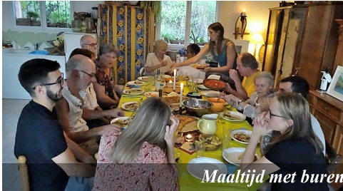
Maaltijd met burens