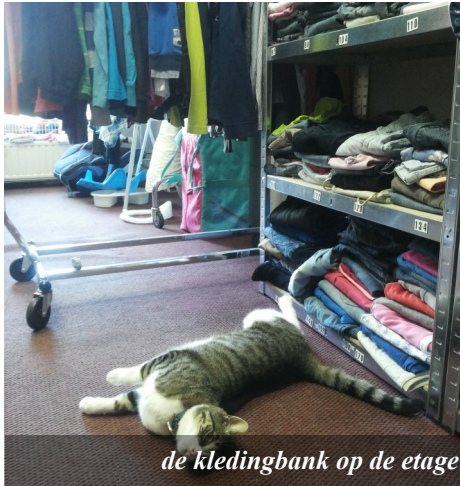
de kledingbank op de etage

We komen veel mensen tegen die kampen met nood, verdriet, armoede, eenzaamheid. Ze verlangen naar een uitweg, verbetering van hun situatie. Ten diepste verlangen ze naar de zegen die alleen God hun kan geven. Weten ze dat? Hoe kunnen we dat aan hen laten weten?