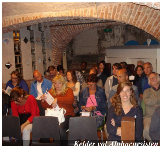
Kelder vol Alphacursisten

Maar wat is dan dat meer? Daar gaat de Alphacursus over. Jezus is er! Hij is de weg, de waarheid en het leven. Dat is voor sommige mensen geen gemakkelijke boodschap. Ik zie tijdens het praatje bij iemand in figuurlijke zin de haren recht overeind gaan. Maar het