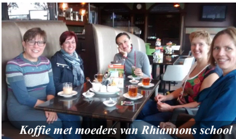
Koffie met moeders van Rhiannons school