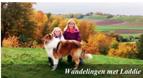
Wandelingen met Laddie