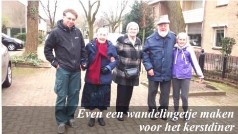
Even een wandelingetje maken voor het kerstdiner