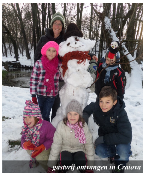
gastvrij ontvangen in Craiova

onderlinge liefde, de ruimte voor het werk van de Heilige Geest en het 'naar buiten gericht zijn' waren dingen die ons gelijk opvielen. Veel van de mensen die komen, zijn kortgeleden tot geloof gekomen. Tegelijkertijd zijn veel leiders uit de gemeente de afgelopen jaren verhuisd/geëmigreerd, waardoor de gemeente 'kader' mist. Hun vraag en ons verlangen sluiten daarin goed bij elkaar aan.