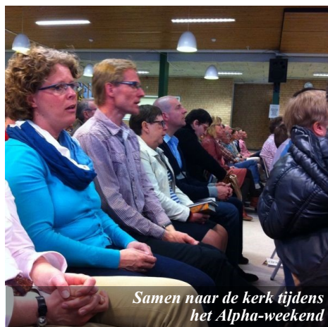
Samen naar de kerk tijdens het Alpha-weekend