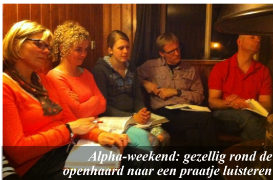
Alpha-weekend: gezellig rond de openhaard naar een praatje luisteren

Tijdens het afgelopen halfjaar deden we de Alpha-cursus met twintig cursisten. Wat mochten we veel groei zien voor wat betreft geloof en vertrouwen in God. En wat heerlijk om mensen thuis te zien komen in de kerk. "Achthonderd mensen bij elkaar, veel jonge gezinnen. Dat had ik niet verwacht. Het voelde als thuiskomen. Met zo'n grote groep de liefde van en voor Jezus ervaren, dat is heel bijzonder."