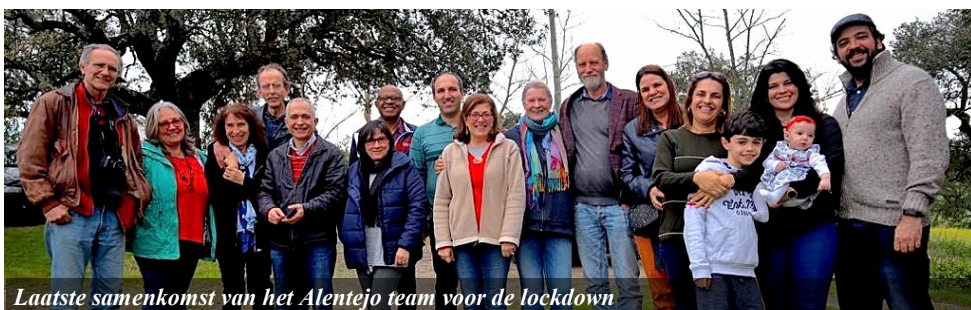
Laatste samenkomst van het Alentejo team voor de lockdown

Stuur ons dan even een berichtje via arendjan.zwart@ecmi.org