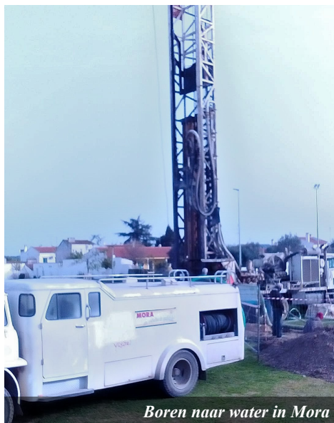
Boren naar water in Mora

“Door het Evangelie handen en voeten te geven, kunnen de inwoners van Mora werkelijk kennismaken met het Woord dat leven geeft.”