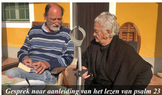
Gesprek naar aanleiding van het lezen van psalm 23

Sinds half maart is in Portugal de noodtoestand van kracht. Scholen, restaurants en winkels zijn gesloten, behalve de supermarkten en de apotheek. Wij mogen nog wel een kleine wandeling maken, maar niet het dorp verlaten. Samenkomsten mogen met een maximum van vijf personen. Geen