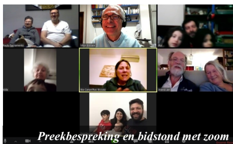
Preekbespreking en bidstond met zoom