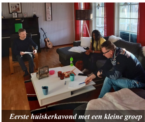
Eerste huiskerkavond met een kleine groep