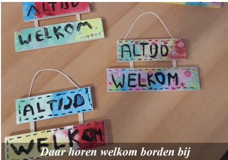
Daar horen welkom bordes bij