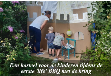
Een kasteel voor de kinderen tijdens de eerste 'life' BBQ met de kring