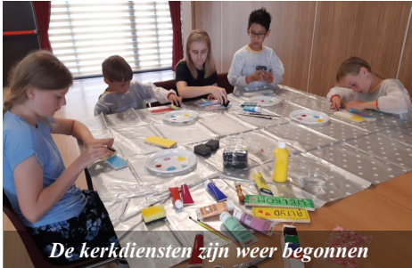
De kerkdiensten zijn weer begonnen