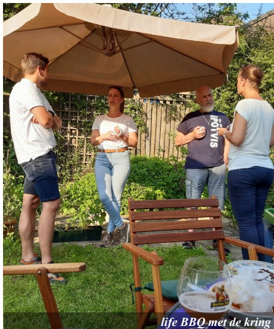
life BBQ met de kring

Het is genieten dat we elkaar weer kunnen ontmoeten. We hebben dit in juli meteen gevierd met een BBQ met de kring. Het was heerlijk om elkaar weer te zien, lekker samen te eten en te luisteren naar de diverse verhalen, zoals de moeilijke momenten die we ervaren met de ‘online bijbelstudies’ en hoop voor het nieuwe seizoen. Het afgelopen seizoen hebben we elkaar om de week online ontmoet en samen geleerd uit het woord van God. Onze kringen beginnen weer in september. Wat willen we ontdekken tijdens die avonden? Gods liefde en genade. We willen ontdekken hoe we God en de ander kunnen dienen. We willen veranderen