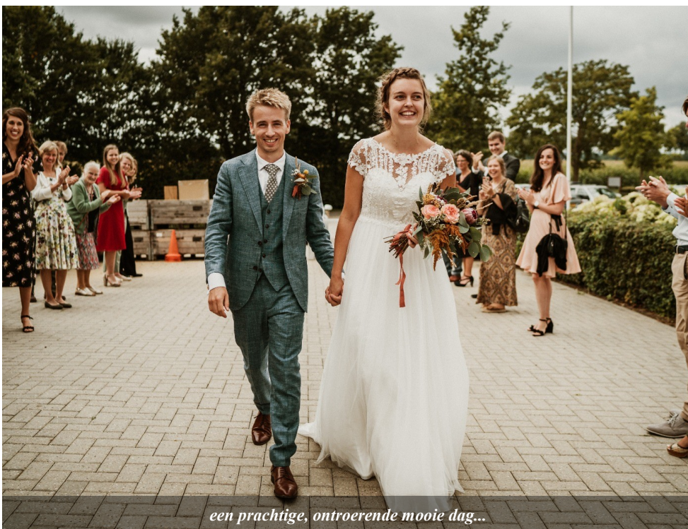
een prachtige, ontroerende mooie dag...