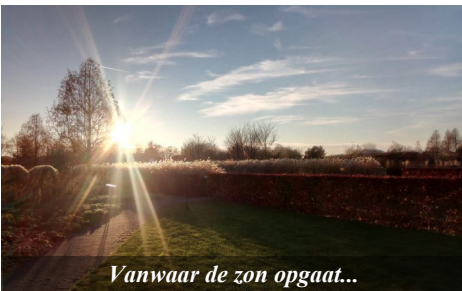
Vanwaar de zon opgaat...

broer en zus de liefde van Jezus, de bijbel het gebed en geloof hebben laten zien en ervaren van jongs af aan.