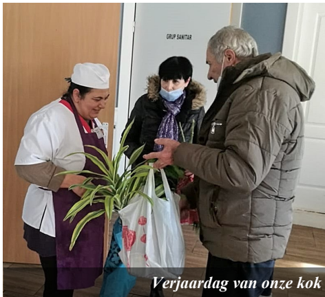
Verjaardag van onze kok

Het afgelopen jaar zijn er veel nieuwe mensen in de gemeente bijgekomen, vooral via contacten van verschillende gemeenteleden. Begin februari konden we de bouw afronden. Net op tijd want de nieuwe kerkzaal zit tot de laatste stoel vol! Op dit moment hebben we een doopcursus met zeven mensen. Het is een diverse groep: van politieman tot dagloner. Ze hebben allemaal een bijzondere ervaring met God meegemaakt en besloten om zich te bekeren. We zien uit naar het doopfeest.