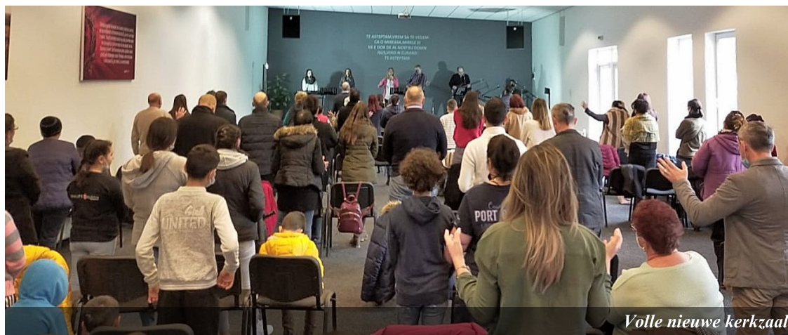
Volle nieuwe kerkzaal

In de kantine (gaarkeuken) zijn er zowel mensen bij wie we het eten langsbrengen, als mensen die hun eten bij ons ophalen of in de kantine eten. Sinds januari mogen mensen op gepaste afstand weer bij ons eten. Zo'n zes klanten blijven steeds langer hangen. De laatste tijd zien we het contact en het vertrouwen tussen hen onderling groeien en zijn ze niet meer zo op zichzelf. Tijd voor een nieuwe stap dus! Samen met hen nemen we een moment om uit een dagboekje te lezen en hier kort over door te praten. En wanneer wij alweer met andere werkzaamheden bezig zijn, horen we ze nog doorpraten over wat we gelezen hebben!