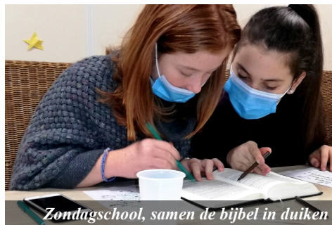
Zondagschool, samen de bijbel in duiken