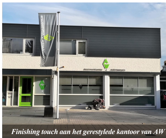
Finishing touch aan het gerestylede kantoor van AW