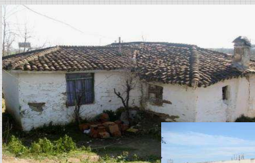
A casa antes.

Nossa visão é plantar uma igreja em Bitaj. Ore por nós, por favor!