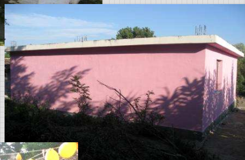
A casa depois!