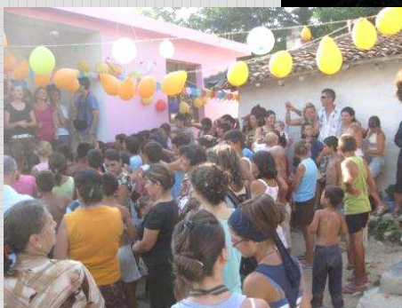
Entrega da nova casa.